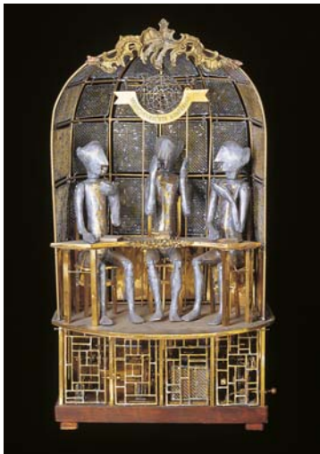
Die Menschenrechtskonferenz